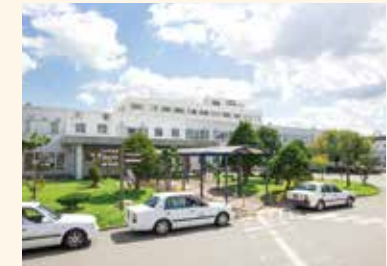
① 旭川医療センター

17の診療科目を設ける総合病院が徒歩圏に。医薬品を中心に幅広い品揃えを誇る大型ドラッグストアもあるので安心。