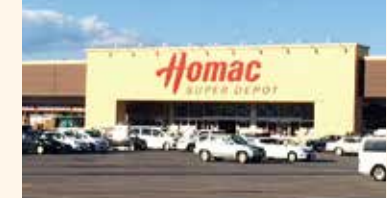
③ ホームマックススーパーデポ 春光店