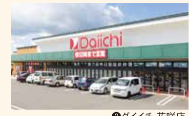
② ダイイチ 花咲店

生鮮をはじめ食料品が充実する大型スーパーと、日用雑貨や住まい関連の商品がそろったホームセンターも近く。