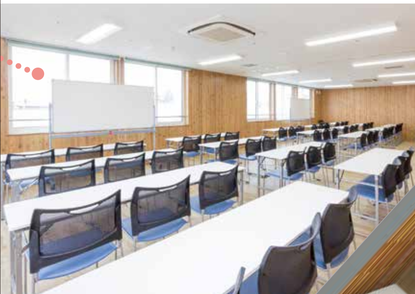
※写真・画像はイメージです。

紅茶を味わいながら、ゆったりリラックスしていただける憩いの空間。入居者はもちろんご家族や地域のみなさんをはじめ一般の方にもご利用いただけます。